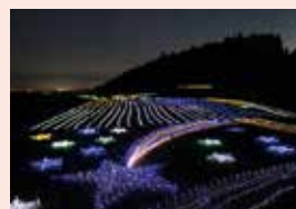
▲八重の棚田のイルミネーション 「八重のきらめき」

先人が築いた石積みに稲穂の揺れる美しい景色が有名な八重の棚田。冬場はひと味違ったイルミネーションスポットに変身するって知ってた? 棚田を彩るのは4.5万球ものLEDソーラーライト。光の映える里山の夜に幻想的な景色が広がる。晴天時は澄んだ夜空に煌めく満天の星空も見どころ。例年12月中旬～2月中旬までの2か月間開催している。