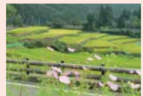
▲八重山の麓に広がる 美しい棚田の景色

お問い合わせ | 世界遺産・ジオ・ツーリズム推進課 Tel.099-216-1371