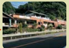
天然かけ流し温泉 溪谷苑