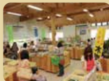
きいれの杜・だいだい (グリーンファーム内) Green Farm (P36・40)