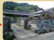
喜入旧麓地区 (令和元年5月に日本遺産に認定)