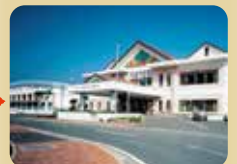
マリンピア喜入 八幡温泉保養館