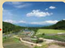
グリーンファーム (各種体験プログラム) Green Farm (P39・40・41)