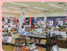
鹿児島ふるさと物産館 Aコープ農畜水産物直売所 (P33)