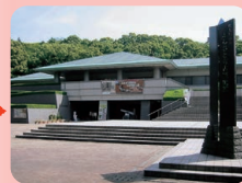
ふるさと考古歴史館